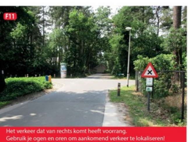
F11 Het verkeer dat van rechts komt heeft voorrang. Gebruik je ogen en oren om aankomend verkeer te lokaliseren!