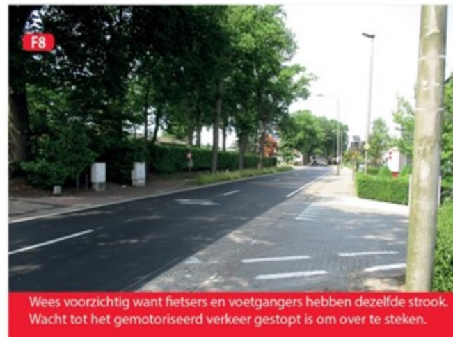
F8 Wees voorzichtig want fietsers en voetgangers hebben dezelfde strook. Wacht tot het gemotoriseerd verkeer gestopt is om over te steken.