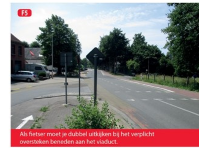
F5 Als fietser moet je dubbel uitkijken bij het verplicht oversteken beneden aan het viaduct.