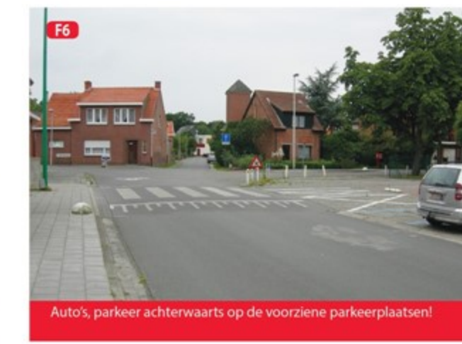
F6 Auto's, parkeer achterwaarts op de voorziene parkeerplaatsen!