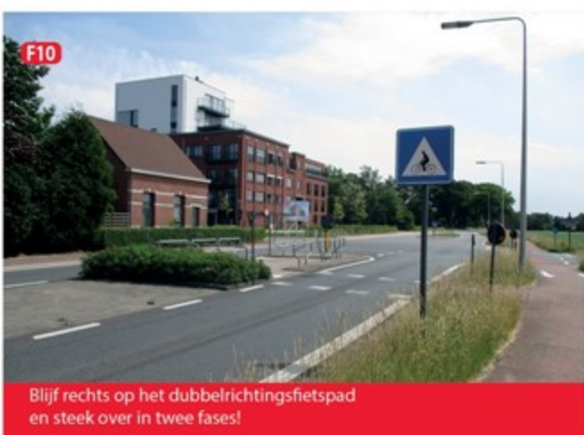
F10 Blijf rechts op het dubbelrichtingsfietspad en steek over in twee fases!