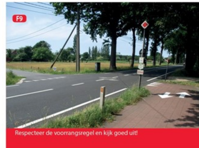
F9 Respecteer de voorrangregel en kijk goed uit!