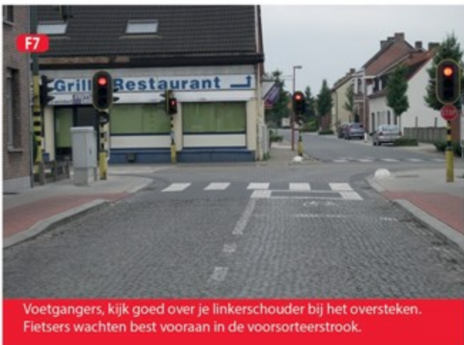
F7 Voetgangers, kijk goed over je linkerschouder bij het oversteken. Fietzers wachten best vooraan in de voorsorteerstrook.