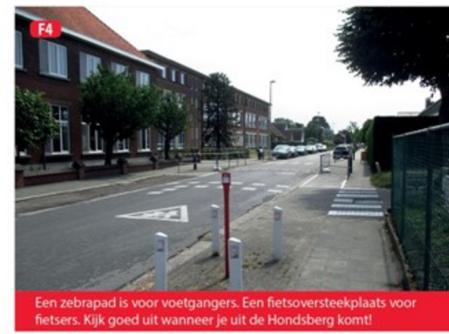
F4 Een zebra is voor voetgangers. Een fietsoversteekplaats voor fietsers. Kijk goed uit wanneer je uit de Hondenberg komt!