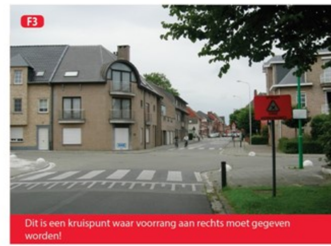
F3 Dit is een kruispunt waar voorrang aan rechts moet gegeven worden!