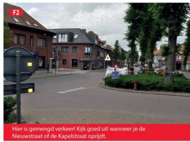
F2 Hier is gemengd verkeer! Kijk goed uit wanneer je de Nieuwstraat of de Kapelstraat oprijdt.