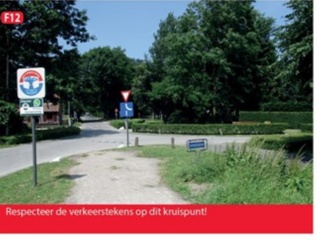
F12 Respecteer de verkeerstekens op dit kruispunt!