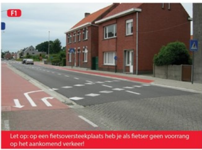
F1 Let op: op een fietsoversteekplaats heb je als fietser geen voorrang op het aankomend verkeer!