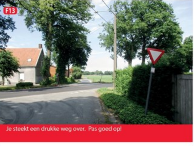
F13 Je steekt een drukke weg over. Pas goed op!